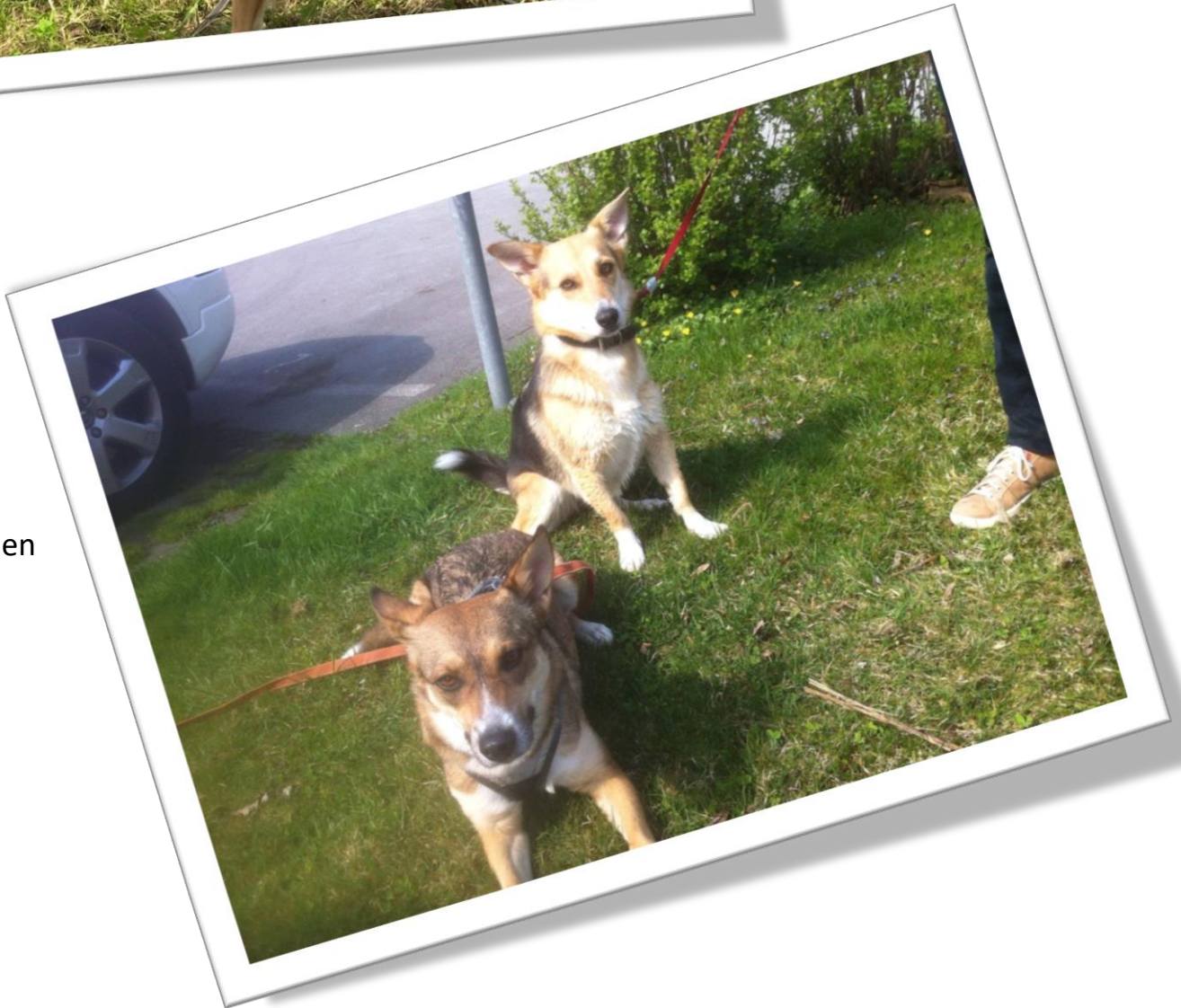
Mit Töchterchen Sharka