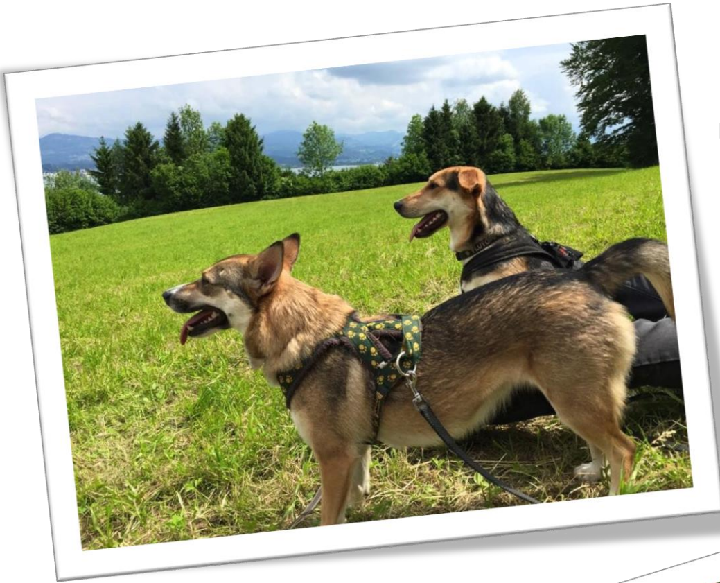
Mit Söhnchen JayJay