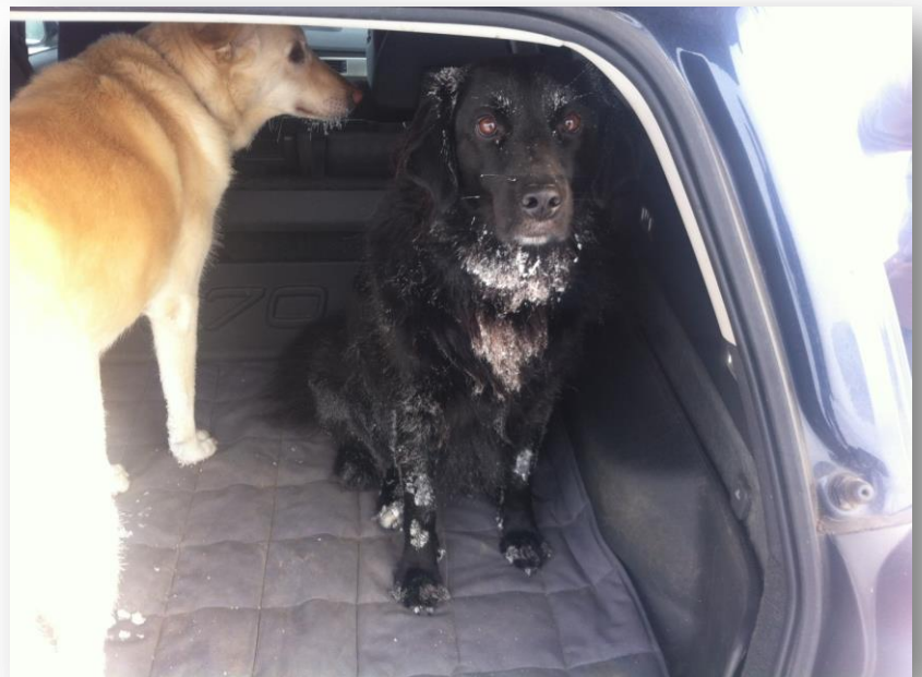
Ursula und Pietro Hunziker